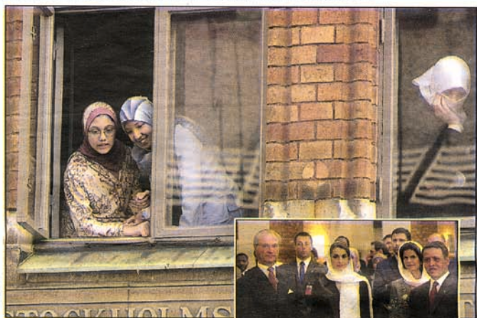
Kungapar på moskébesök Nyfikna flickor fick i går kunglig utsikt från fönstren i Stockholms moské när kung Carl Gustaf, drottning Silvia och Jordaniens kungapar kung Abdullah II och drottning Rania kom på besök, drottningarna för dagen iklädda sjalar.