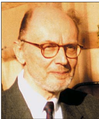
PER AHLMARK Outtröttlig frihetskämpe

SKÅNEPARTIET är en ideell förening, som verkar för Skåne och frihet och som med detta syfte i särskilt program tar ställning i alla frågor av politisk betydelse. SKÅNEPARTIETS flagga är en kvadratisk korsflagga symboliserande Skåne i Norden med inifrån räknat danskt rött, svenskt gult, finländskt vitt och norskt blått på lika stora ytor. (Partistadgarna §§1 och 2).