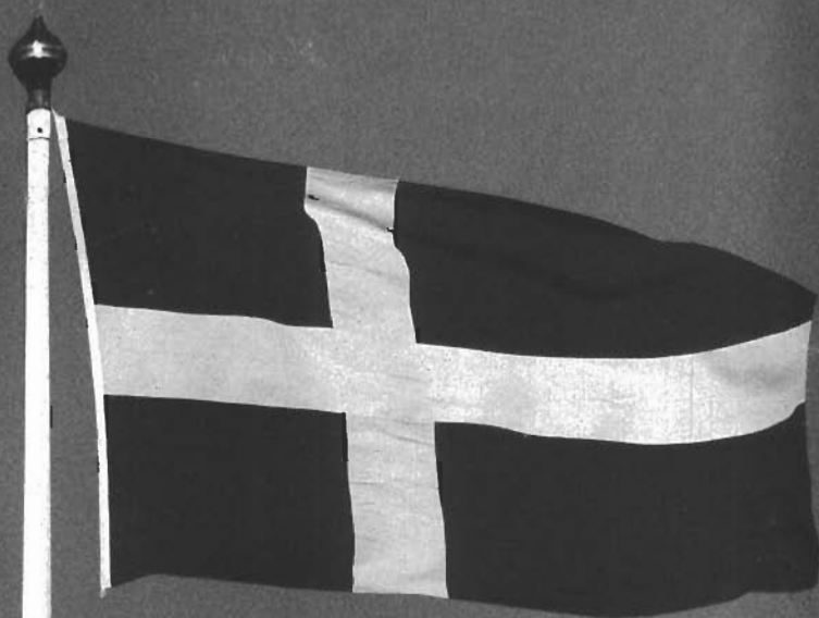
Skånepartiets flagga och skånska flaggan